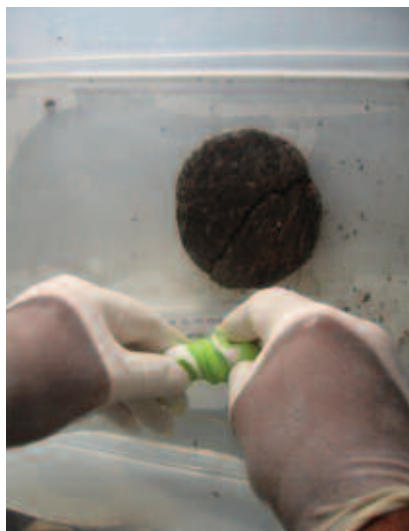
Figura 3. Manipolazione delle gomme siliconiche.

L'osservazione e l'accumulo dei dati provenienti da queste esperienze, potrà portare a positivi riscontri negli impegni futuri che la nostra attività ci riserva.