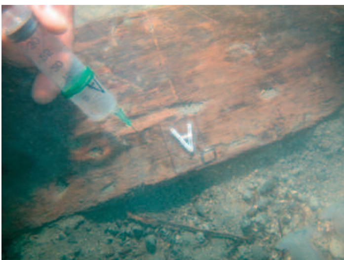
Figura 2. Inoculazione dell'impregnante.

Il campione così trattato è stato protetto, oltre che dal film di polietilene, con pezze di geotessuto ed inglobato nella copertura del sito sommerso.