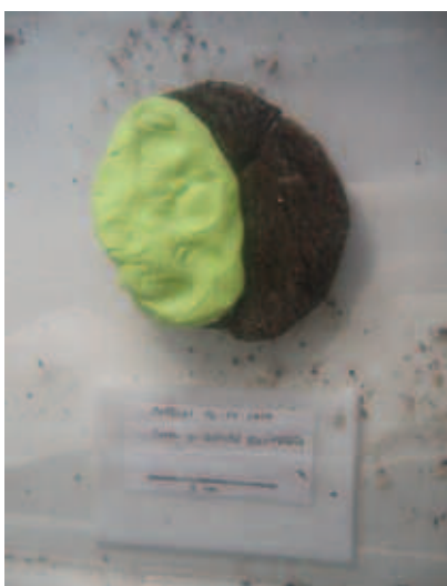
Figura 4. Applicazione della gomma sul reperto.