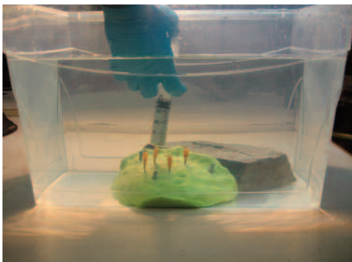
Figura 5. Inoculazione dell'impregnante.