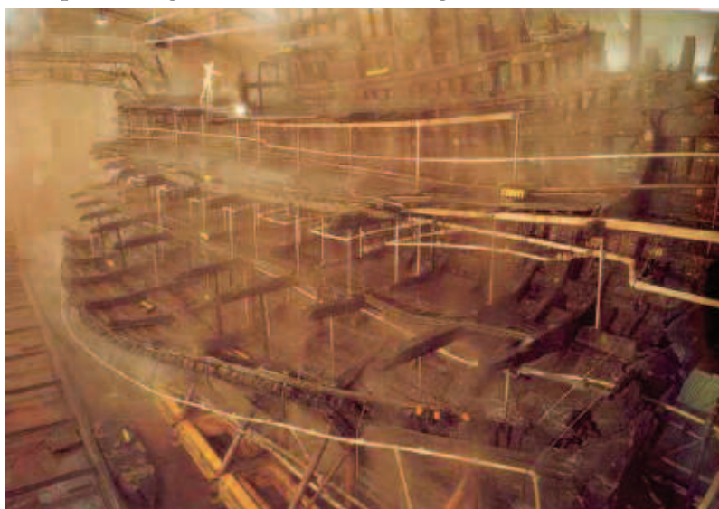
Figura 2. Il relitto del Mary Rose

Tale comparsa fu subito messa in relazione con l'inadeguatezza del sistema di condizionamento ambientale del museo ed alla particolare condizione atmosferica del periodo con alti valori di UR% (oltre il 65%). Le efflorescenze furono campionate e le analisi effettuate evidenziarono una forte acidità del legno, verosimilmente dovuta alla produzione, nelle particolari condizioni di umidità ambientale, di acido solforico 2 . Il processo di formazione di questo acido può rappresentare un reale pericolo per la conservazione del legno archeologico ed è chiaro come l'intero processo dipenda dal tenore di umidità degli ambienti di conservazione e dalla presenza di prodotti di trattamento del legno particolarmente igroscopici, come effettivamente è il polietilenglicol. A poco più di un ventennio di distanza il rinvenimento di un altro relitto, questa volta in acque anglosassoni, ripropose problematiche simili a quelle del Vasa, quando ormai l'esperienza svedese aveva permesso di conoscere oltre i meccanismi di funzionamento del PEG anche quelli di invecchiamento e delle sue interazioni con l'ambiente circostante. Nel 1982, infatti, avvenne la scoperta del Mary Rose, una nave da guerra voluta dal re Enrico VIII ed affondata poco a largo di Portsmouth (in Inghilterra del Sud) nel 1545, durante uno