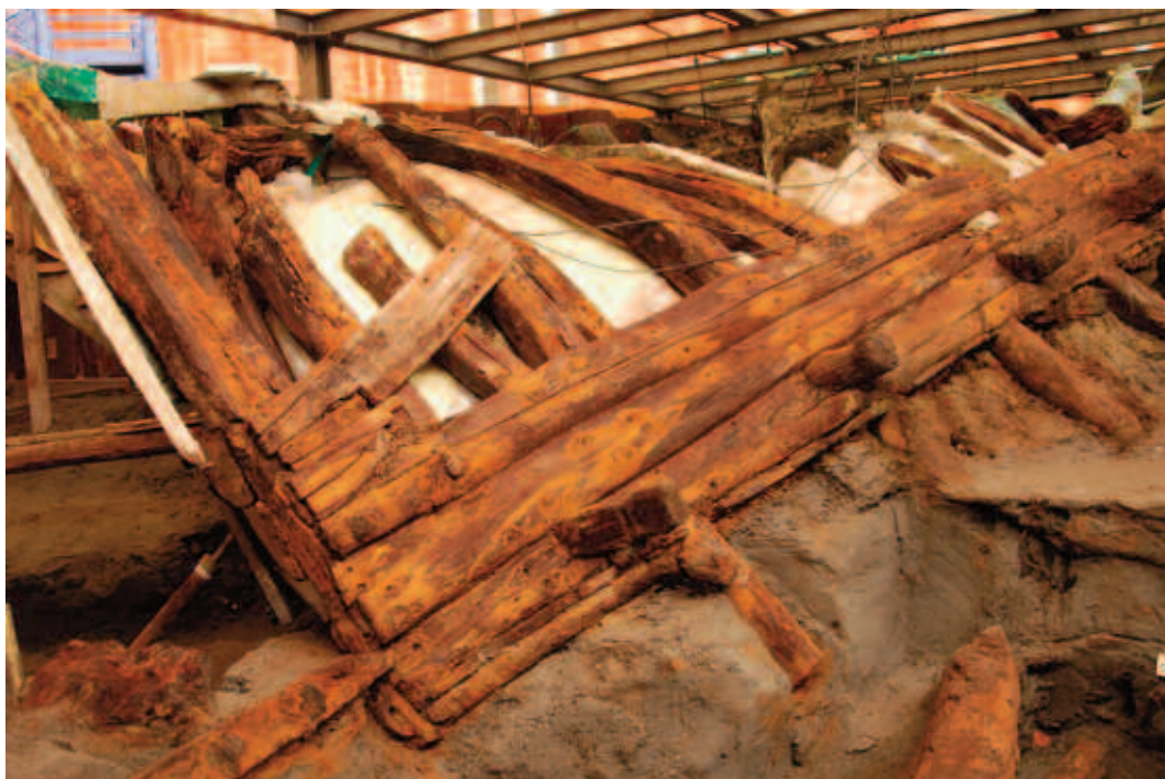
Figura 3. Il relitto della Nave D

Le condizioni di giacitura dei reperti, infatti, sono simili a quelle dei relitti sopra citati anche se in questo caso si tratta di un contesto terrestre, il quale ha garantito condizioni di giacitura favorevoli per il legno, ovvero un ambiente costantemente saturo d'acqua, per la permanenza al di sotto del piano della falda acquifera, ed in uno strato di sedimento privo di ossigeno 5 . Lo scavo archeologico e l'esposizione all'aria avrebbero alterato questo stato di equilibrio e, di conseguenza, compromesso la conservazione dei reperti superstiti. A queste problematiche si è ovviato mediante scavo a sezioni e successiva copertura di quanto scavato con strati di vetroresina per creare nuovamente un ambiente abbastanza anaerobico e riparato dalla luce, permettendo anche la continua bagnatura dei legni.