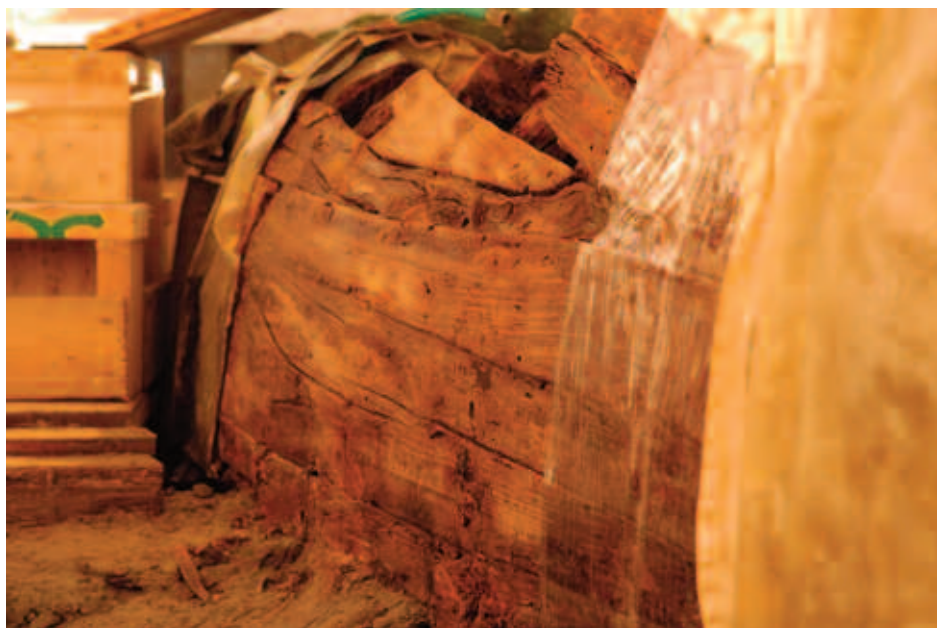
Figura 4. Il relitto della Nave D, dettaglio

La metodologia scelta, inoltre, ha previsto la realizzazione di gusci chiusi di vetroresina rinforzati che garantivano al relitto la connessione delle varie parti e la possibilità, anche senza procedere allo smontaggio degli scafi, di resistere alle tensioni che si sarebbero verificate in fase di sollevamento.