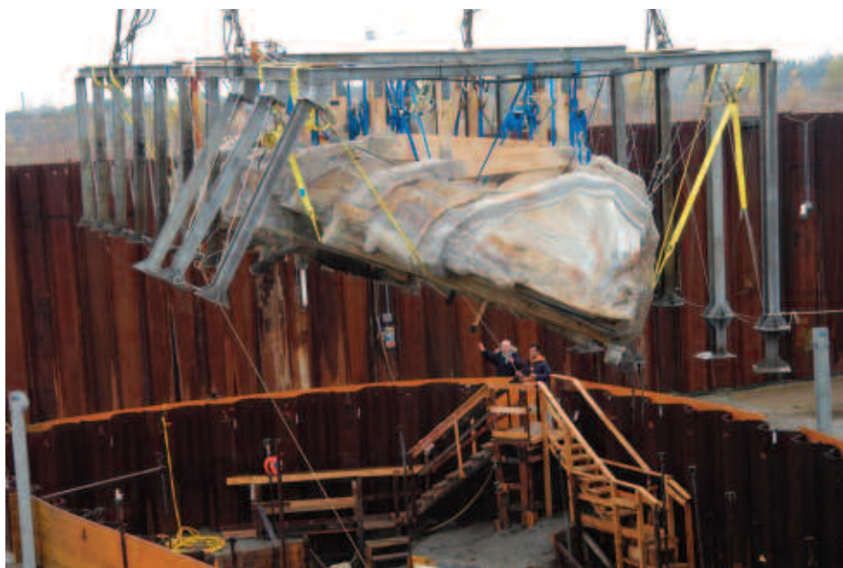
Figura 5. Il sollevamento della Nave D

La metodologia scelta, inoltre, ha previsto la realizzazione di gusci chiusi di vetroresina rinforzati che garantivano al relitto la connessione delle varie parti e la possibilità, anche senza procedere allo smontaggio degli scafi, di resistere alle tensioni che si sarebbero verificate in fase di sollevamento.