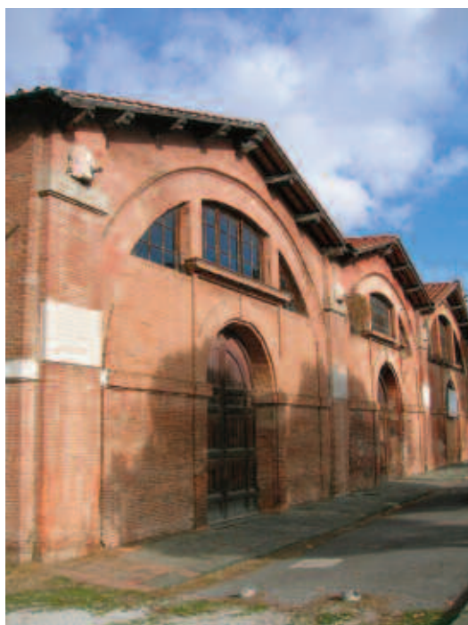
Figura 6. Gli Arsenali Medicei di Pisa